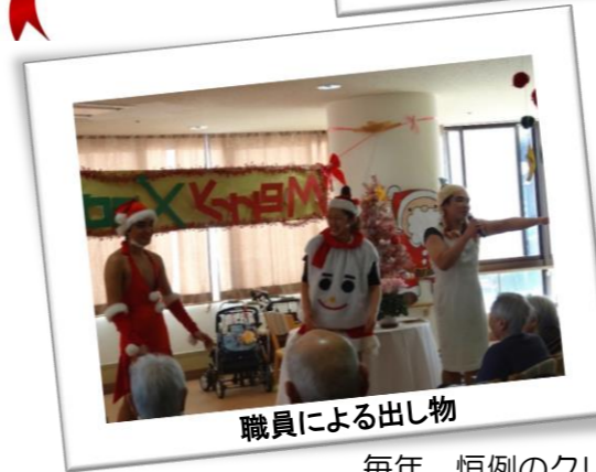
職員による出し物