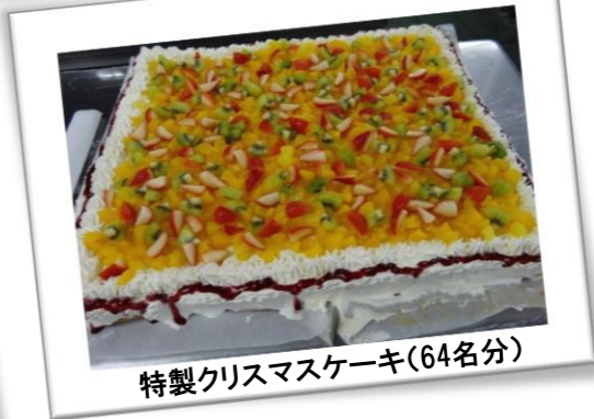
特製クリスマスケーキ(64名分)

毎年、恒例のクリスマス会です。 ご家族様をご招待して実施いたしました。 スタッフによる出しものを披露したり、栄養課のスタッフもフル稼働でクリスマスケーキを作り、プレゼントしてくれ大変にアットホームなクリスマス会となりました。