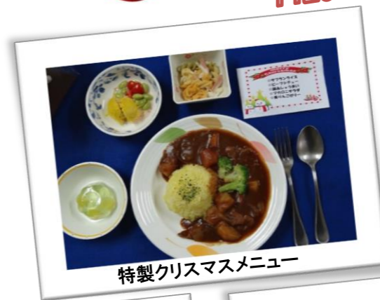
特製クリスマスメニュー