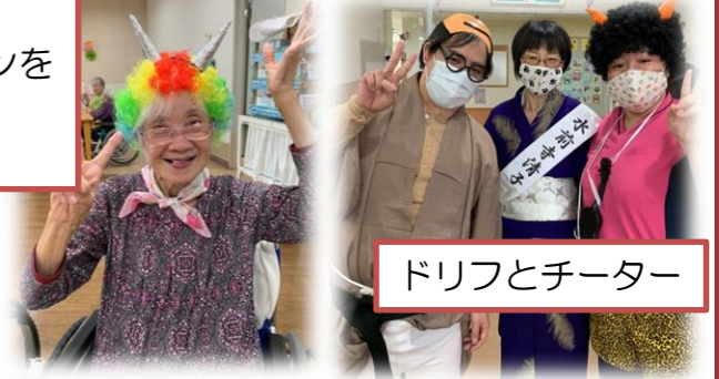
ドリフとチーター